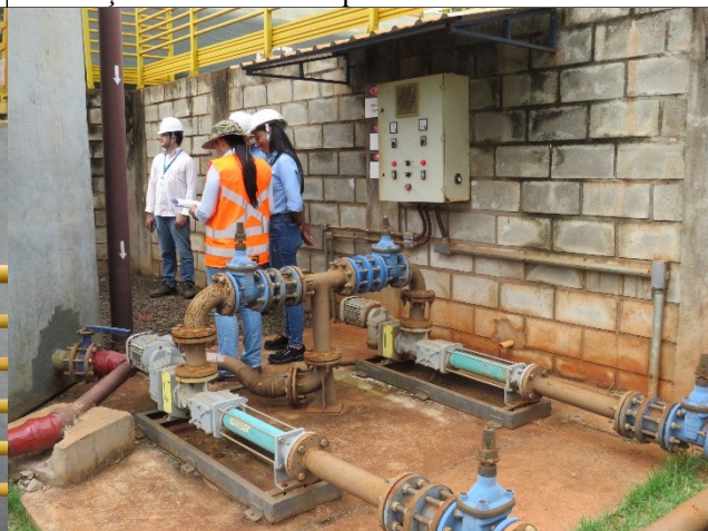
Descrição: Tubulações que encaminham o material decantado do fundo dos tanques para os filtros/prensa.