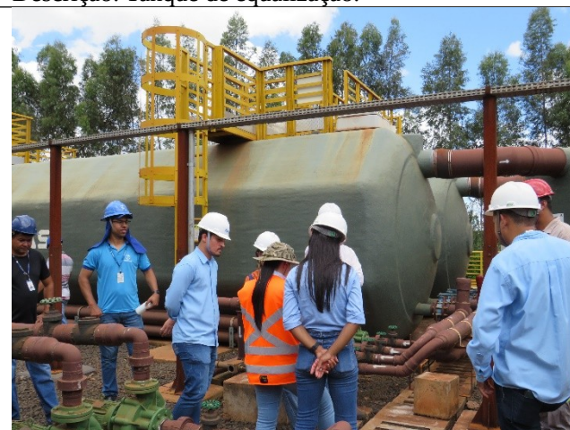
Descrição: Reator anaeróbico 07 e 08.