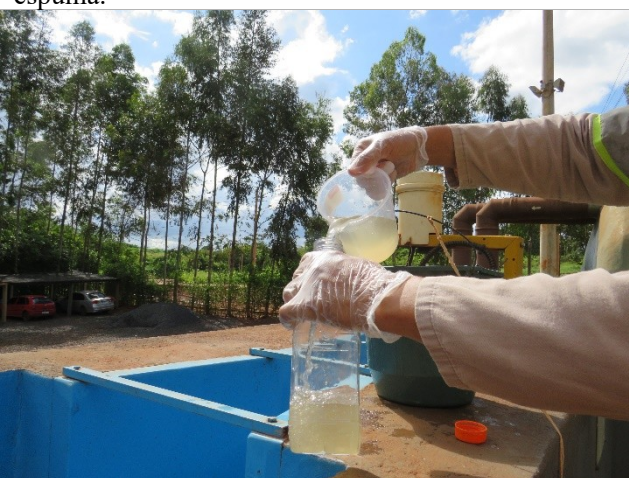
Descrição: Coleta de efluente para análise.