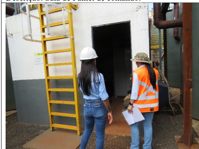
Autor: AMAE Descrição: Depósito de materiais de manutenção da ETE.