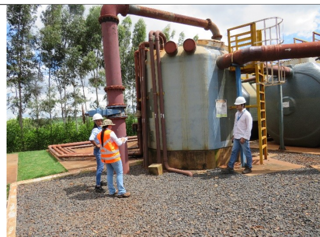
Descrição: Tanque de equalização.