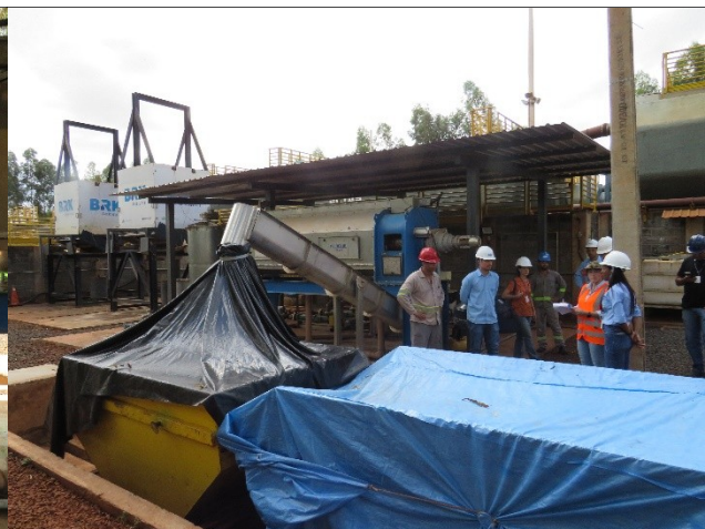
Descrição: Lodo cai na caçamba para ser destinado ao aterro municipal.