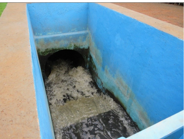
Descrição: Saída do efluente na Calha Parshall sem espuma.