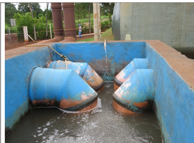
Autor: AMAE Descrição: Aplicação de antiespumante.