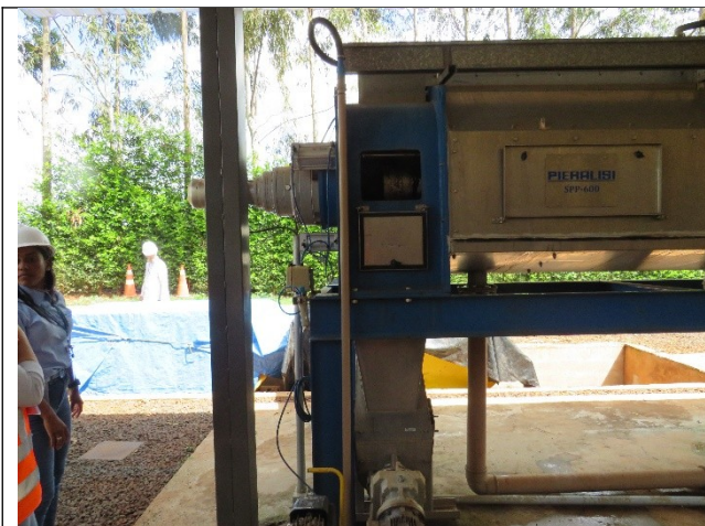
Autor: AMAE Descrição: Filtro prensa