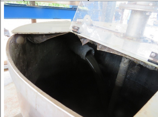
Descrição: Entrada de efluente decantado para flotação no filtro prensa