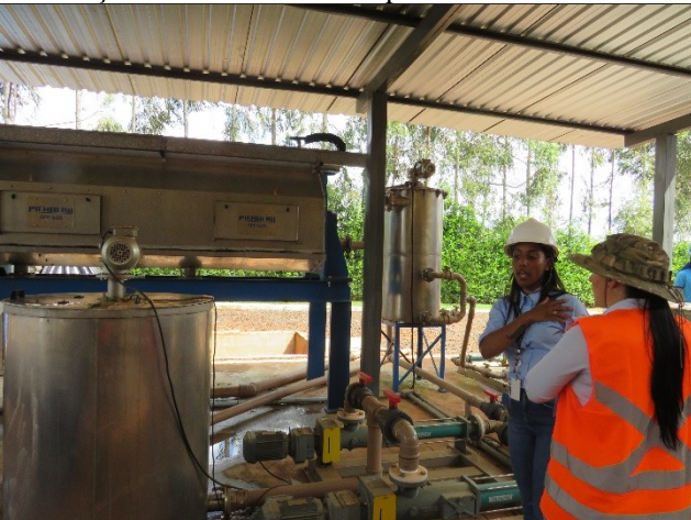
Autor: AMAE Descrição: Aplicação de polímero catiônico.