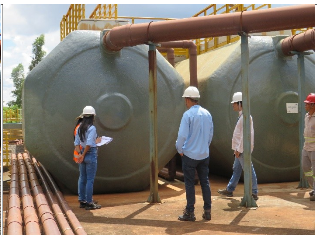
Descrição: Reator anaeróbico 01 e 02.