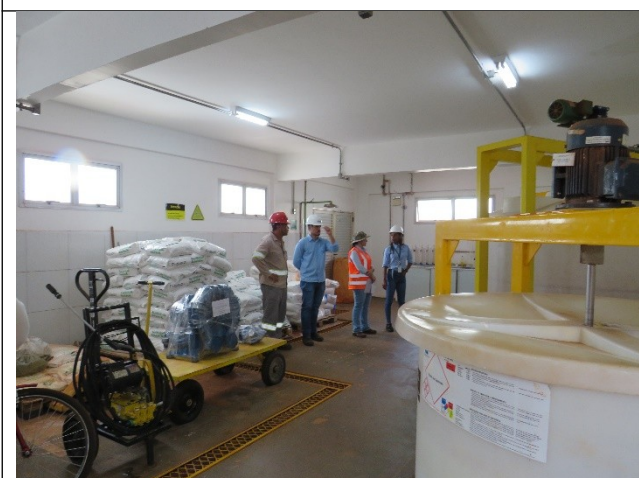
Autor: AMAE Descrição: Casa de químicos