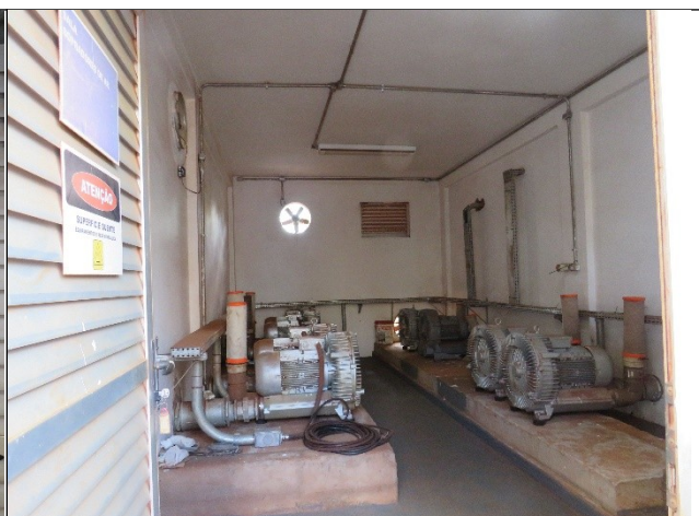
Descrição: Casa de máquinas/Sopradores.