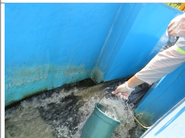
Descrição: Coleta de efluente para análise.