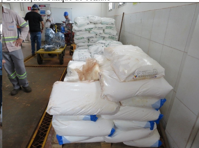
Autor: AMAE Descrição: Alguns exemplares de sulfato de alumínio estavam com prazo de validade expirado.