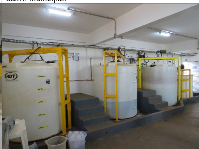
Descrição: Tanque de contato