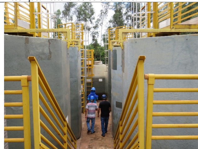
Descrição: Decantadores e tanque de desinfecção no fundo.