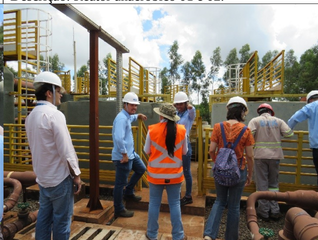
Descrição: Início dos tanques floculadores.